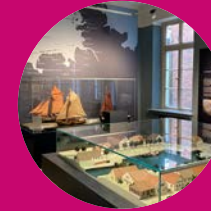
Deutsches Sielhafenmuseum Carolinensiel