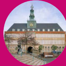
Ostfriesisches Landesmuseum Emden