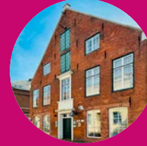
Schiffahrtsmuseum Unterweser Brake