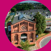
Nordwestdeutsches Museum für IndustrieKultur Delmenhorst