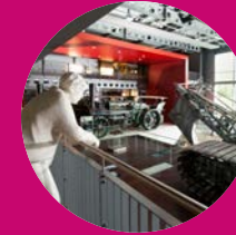
Emsland Moormuseum Geeste