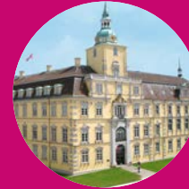
Landesmuseum Kunst & Kultur Oldenburg