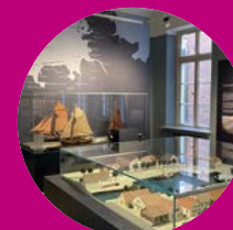
Deutsches Sielhafenmuseum Carolinensiel