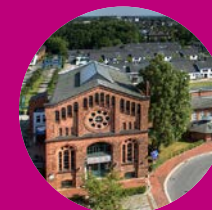
Nordwestdeutsches Museum für Industriekultur Delmenhorst