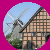
Museumsdorf Cloppenburg Niedersächsisches Freilichtmuseum