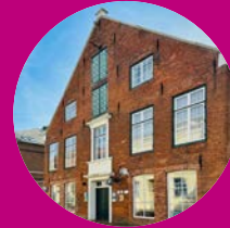
Schiffahrtsmuseum Unterweser Brake