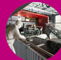
Emsland Moormuseum Geeste