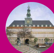
Ostfriesisches Landesmuseum Emden