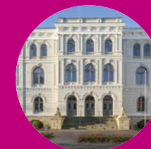
Landesmuseum Natur und Mensch Oldenburg