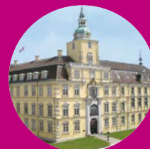
Landesmuseum Kunst & Kultur Oldenburg