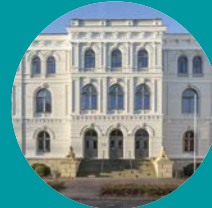
Landesmuseum Natur und Mensch Oldenburg