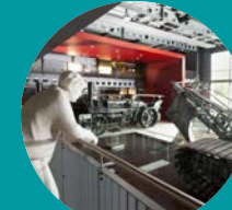
Emsland Moormuseum Geeste