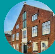
Schiffahrtsmuseum Unterweser Brake