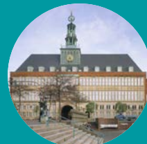
Ostfriesisches Landesmuseum Emden