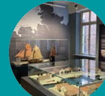
Deutsches Sielhafenmuseum Carolinensiel