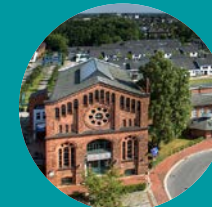
Nordwestdeutsches Museum für IndustrieKultur Delmenhorst