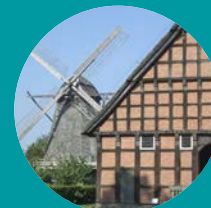
Museumsdorf Cloppenburg Niedersächsisches Freilichtmuseum