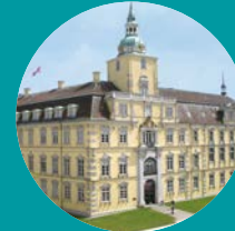
Landesmuseum Kunst & Kultur Oldenburg